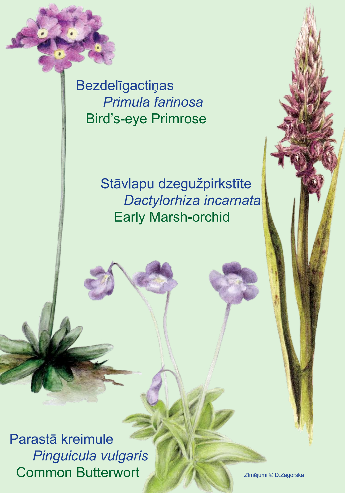
Bezdelīgactiņas Primula farinosa Bird's-eye Primrose

Stāvlapu dzegužpirkstīte ( Dactylorhiza incarnata ) ir viena no 32 Latvijā sastopamām orhidejām. Lielezera krastos iespējams ir viena no lielākajām un labākajām šīs sugas atradnēm Limbažu rajonā. Daudzos sarkanvioletos ziedus raisa no maija līdz jūlijam.