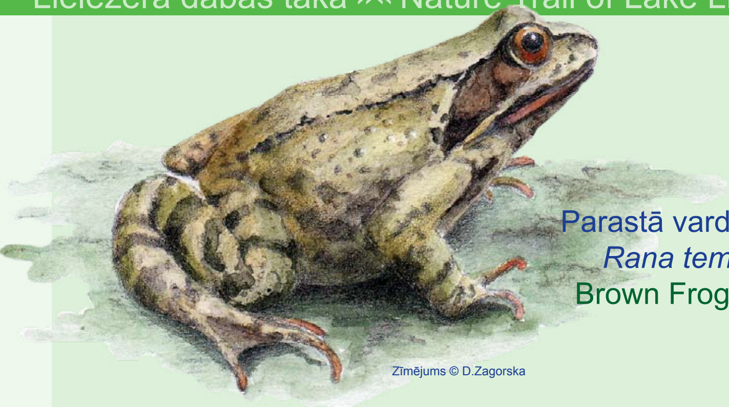
Parastā varde Rana temporaria Brown Frog

Brūnajām vardēm ķermeņa garums ir 6-9 cm. Āda gluda. Mugura brūngana, pelēka, vai krēmkrāsā ar tumšiem plankumiem vai punktiņiem. Vēderpuse balta vai iedzeltena, plankumaina. Ķermeņa virspuse nekad nav zaļa un galvas sānos pāri acij stiepjas tumšs plankums. Latvijā ir divas brūno varžu sugas — parastā varde ( Rana temporaria ) un purva varde ( Rana arvalis ). Otrā ir daudz retāka. Abas sugas ir grūti atšķiramas. Izņēmums ir nārsta laiks, kad purva varžu tēviņiem āda iekrāsojs zilgana vai sudrabaina. Parastā varde nārsta laikā rūc. Purva vardes balsi literāti parasti apzīmē kā attālas suņa rejas.